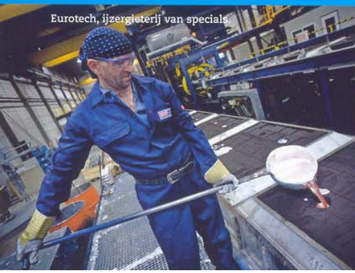
Eurotech, ijzergieterij van specials