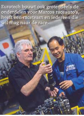
Eurotech bouwt ook grotendeels de onderdelen voor Marcos raceauto's, heeft een raceteam en iedereen die wil mag naar de race.